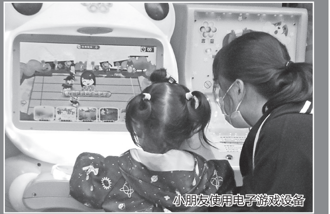
小朋友使用电子游戏设备