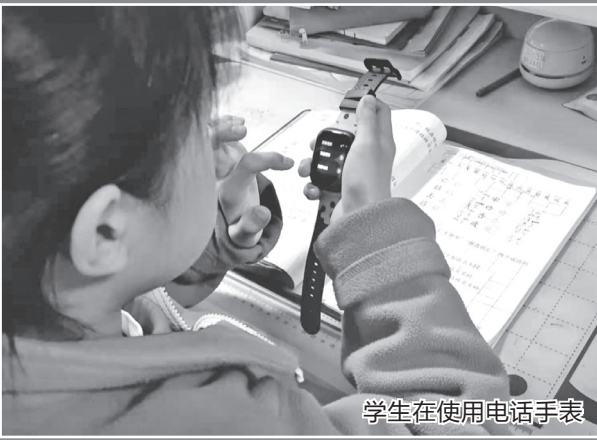
学生在使用电话手表