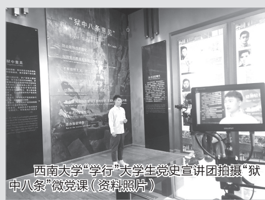
西南大学“学行”大学生党史宣讲团拍摄“狱中八条”微党课(资料照片)