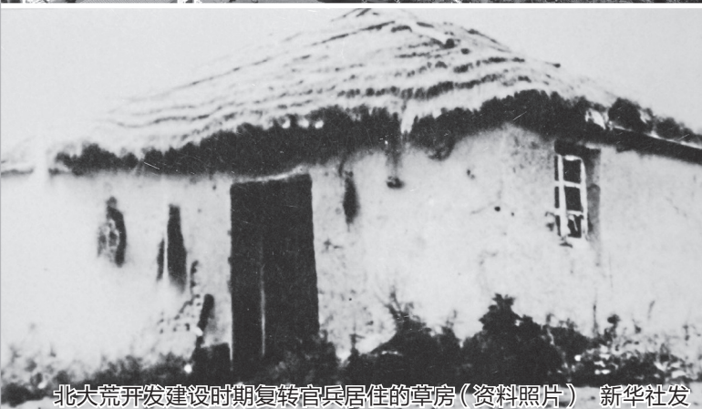
北大荒开发建设时期复转官兵居住的草房(资料照片)