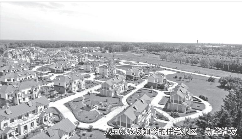
八五〇农场如今的住宅小区 新华社发