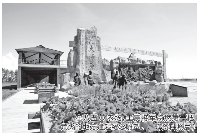
在八五〇农场,王震将军点燃第一把荒火的地方建起纪念雕塑。(资料照片)

1955年5月,大地解冻,官兵们迎来了建场的第一个春天。一些低洼地还有冰碴,牲口在里面抬不起蹄,一步一