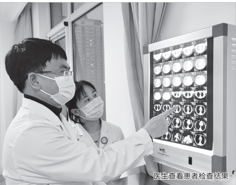
医生查看患者检查结果

孩子是祖国的未来、家庭的希望,他们的健康事关千家万户的幸福。多年来,市人民医院儿科团队,始终秉承“一切为了孩子,为了孩子一切”这一服务理念,用精湛的医术、无私的奉献和关爱,悉心