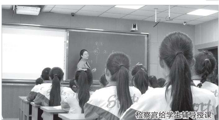
检察官给学生辅导授课

接待群众来信来访71件(次),100%实现“7日内程序性回复、3个月内办理过程或结果答复”。 未成年人是祖国的未来和民族的希望,检察院将关心未成年人工作与检察工作相结合,用司法守护未成年人健康成长,严厉打击