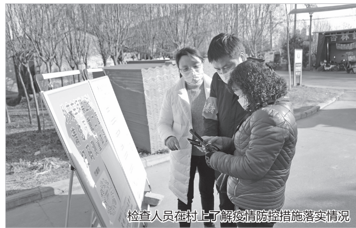
检查人员在村上了解疫情防控措施落实情况