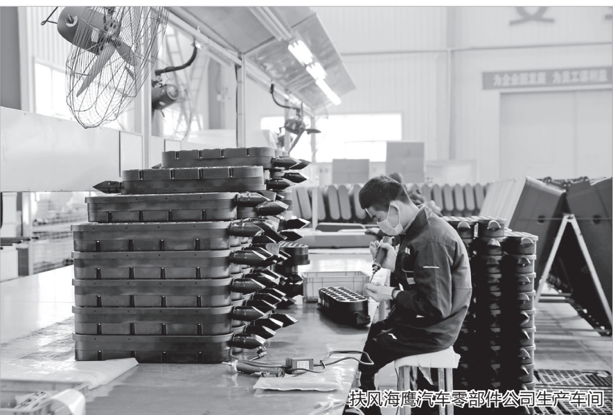
扶风海鹰汽车零部件公司生产车间