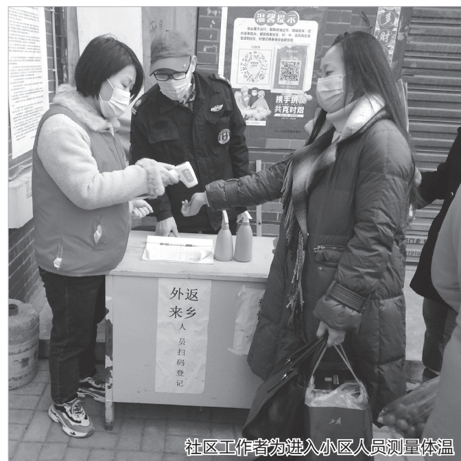
社区工作者为进入小区人员测量体温