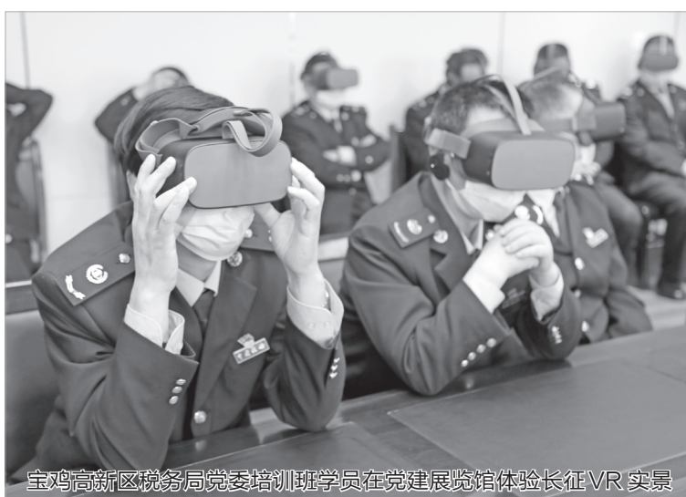
宝鸡高新区税务局党委培训班学员在党建展览馆体验长征VR实景

砥砺奋进再出征,人间正道谱春秋。宝鸡西建非公有制企业党建学院这艘航船已经扬帆起航,正在努力将学院打造成为红色引擎的新平台、文化引领的新高地、创新活力的新源泉。