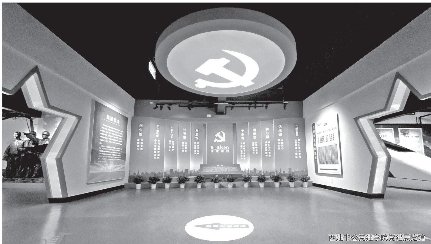
西建非公党建学院党建展览馆

近年来,陕西西建集团以打造“红色引擎”党建品牌为抓手,助力“两新”组织高质量发展,实现了“党建强、发展强”的目标。2020年6月15日,由陕西西建集团党委筹建的宝鸡西建非公有制企业党建学院挂牌运行,对全市乃至全省、全国非公企业健康发展起到重要推动作用。从本期开始,由本报和宝鸡市非公有制经济组织党委、宝鸡西建非公党建学院联合主办的《非公党建专刊》正式开刊,敬请关注!