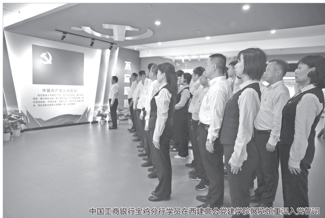
中国工商银行宝鸡分行学员在西建非公党建学院展览馆重温入党誓词

党性是推动企业发展的红色基因。西建集团党委通过抓班子、带队伍、促发展,探索形成了“三抓五化四聚焦”党建品牌,走出了一条“党建引领、文化铸魂、创新发展”的新路子。2019年7月,由冯西见带队的集团党委一班人赴浙江、安徽、山东、河南等地观摩了吉利集团、老板电器、杭州市黄龙商圈等“两新”组织党建工作,深刻感受到党建这一“红色引擎”激发的巨大力量,集团党委班子一行对党的十九大报告中提出的非公经济“两个健康”与构建“亲清”新型政商关系,有了更深层次的认识,于是萌发了筹建西建非公党建学院的初心。党委书记冯西见挂帅,成立党建学院筹建工作组,确保人、财、物优先保障党建学院建设,邀请专家组研讨论证、反复推敲筹建方案,对涉及党建展览馆的图文,严格落实“三审三校”制度,把意识形态工作责任制扛在肩上、放在心头,学院筹建过程中得到省、市、区各级领