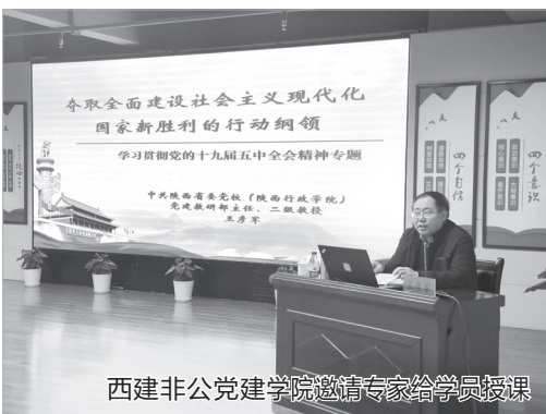
西建非公党建学院邀请专家给学员授课