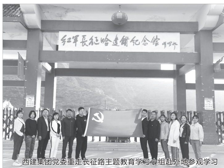
西建集团党委重走长征路主题教育学习小组赴外地参观学习