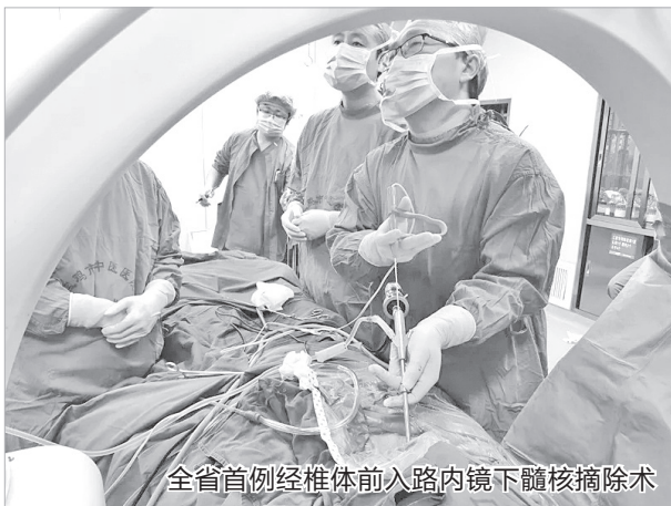
全省首例经椎体前入路内镜下髓核摘除术