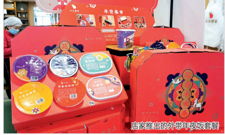
店家推出的外带年夜饭套餐