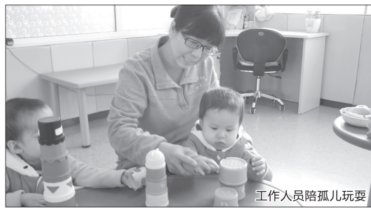
工作人员陪孤儿玩耍