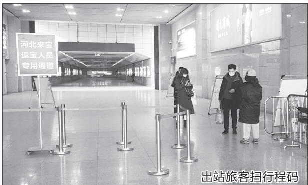
出站旅客扫行程码