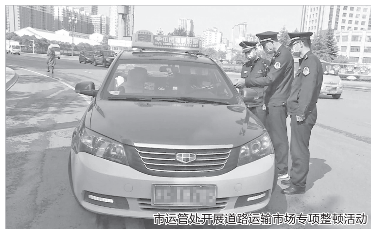
市运管处开展道路运输市场专项整顿活动

为市场整顿的重点，采取宣传教育、市场调研、联合执法等方式，不断规范和净化道路运输市场秩序。市运管处先后警示约谈滴滴出行、哈啰出行等5家网约车平台公司，下发整改通知书，下架顺风车业务，督促清退不合规车辆5.9万辆，严厉打击非法运营网约车246辆。截至2020年底，全市审批网络预约出租汽车企业5户，办理网络预约出租汽车运输证671件，先后举办网约车驾驶员证培训班47期，培训合格率99%。同时，对我市网约车经营服务管理情况进行市场调研和分析评估，梳理出车辆标准和服务质量信誉考核等9方面的问题，提出《网络预约出租汽车经营服务管理实施细则(暂行)》修订意见，建立健全出租车行业维稳工作常态机制，与公安部门建