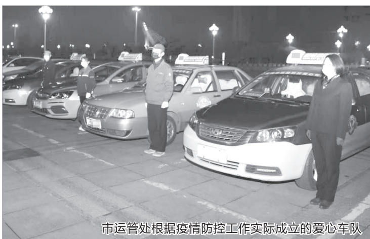
市运管处根据疫情防控工作实际成立的爱心车队

工作与运管工作相融合，以党建促发展，让党员干部发挥先锋模范作用，不断增强队伍的凝聚力、战斗力，确保运输管理工作水平稳步提升。