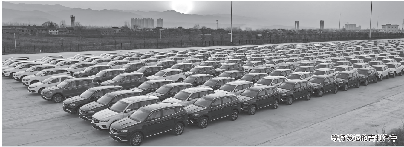
等待发运的吉利汽车

园、生活配套4大板块,项目建成后,预计年纳税5亿元,接待游客约30万人次,提供就业岗位1000个。