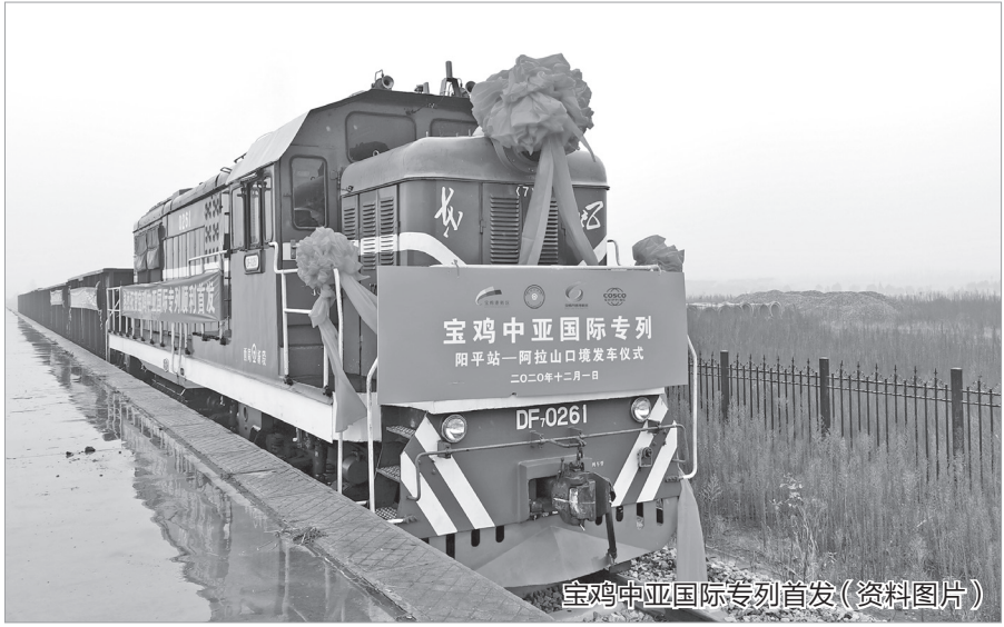
宝鸡中亚国际专列首发(资料图片)

凡是过往,皆为序章。在“十四五”开局之年,宝鸡港务区将按照“两带四组团”空间布局,围绕产业链部署创新链,围绕创新链布局产业链,全力落实谋划的“十四五”期间的区域基础设施、现代服务业、新型城镇化等重点领域重大项目,奋力谱写宝鸡港务区新时代追赶超越新篇章。