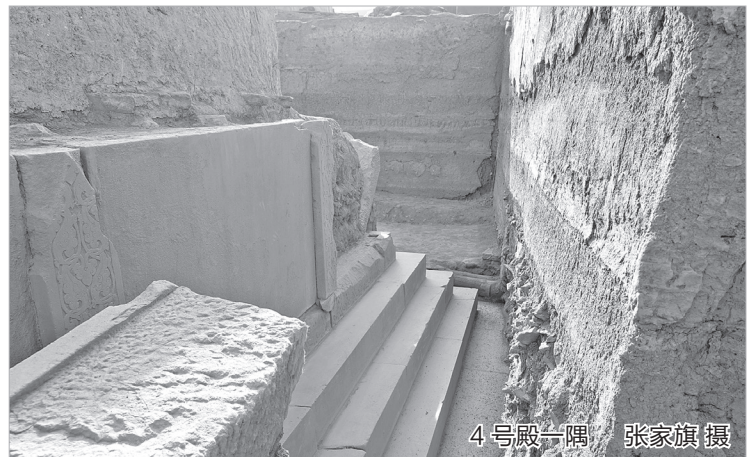
4号殿一隅