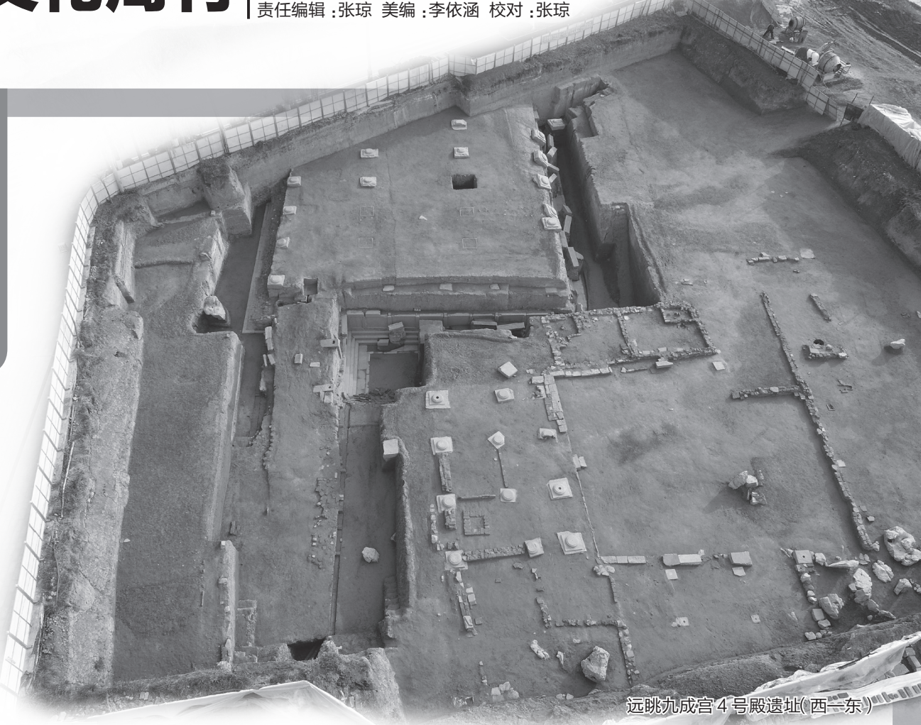
远眺九成宫4号殿遗址(西—东)