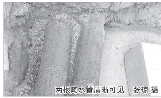
两根陶水管清晰可见