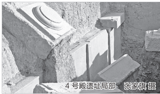
4号殿遗址局部