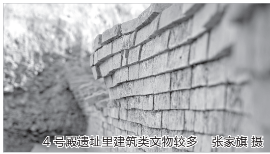
4号殿遗址里建筑类文物较多

在4号殿身上,隋、唐两代建筑叠压痕迹明显,让人感受到唐代矫正隋代奢华弊政的风气。