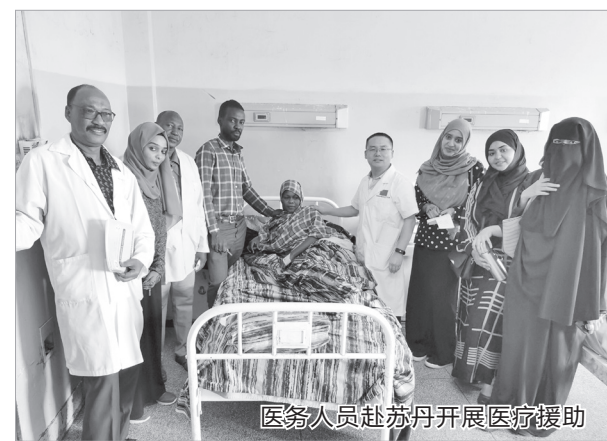
医务人员赴苏丹开展医疗援助

2020年，市中心医院积极响应上级号召，推进健康扶贫工作，圆满完成援藏、援外任务。这一年，医院组建医疗队分别前往麟游、陇县、千阳等地开展大骨节病摸底筛查，为27名贫困患者免费实施全膝关节置换手术。积极开展“爱心助农”消费扶贫活动，帮助农产品滞销贫困户解除燃眉之急。医院5名专业技术人员赴西藏阿里改则县人民医院开展医疗帮扶工作，共指导开展手术70余台，参与急危重患者抢救40余次，指导开展的12项新技术新项目填补当地空白，为期5年的医疗援藏工作取得