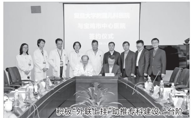
积极“外联上挂”助推专科建设上台阶

盟，借智借力促进学科能力建设；建成国家级房颤中心和全国儿童哮喘标准化门诊区域示范中心，获得全国静脉血栓防治中心优秀单位殊荣；呼吸与危重症医学科全国首家通过国家PCCM规范化线上认定。