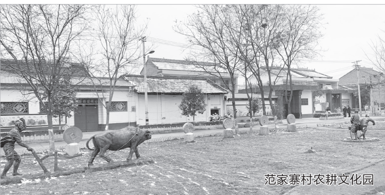
范家寨村农耕文化园

宁渠村的宰相路干净整洁,花坛前立着文化宣传牌,每根电线杆上都有文明标语。为了宣传文化培育乡风文明,宁渠村投资40万元在河营路、全村主干路,制作党建、法治、廉政文化、村风家风民风宣传牌80面,墙体绘画60多幅,打造文明文化建设宣传“一条街两条路”的格局,弘扬社会主义核心价值观。