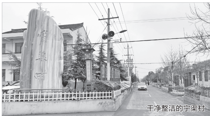
干净整洁的宁渠村