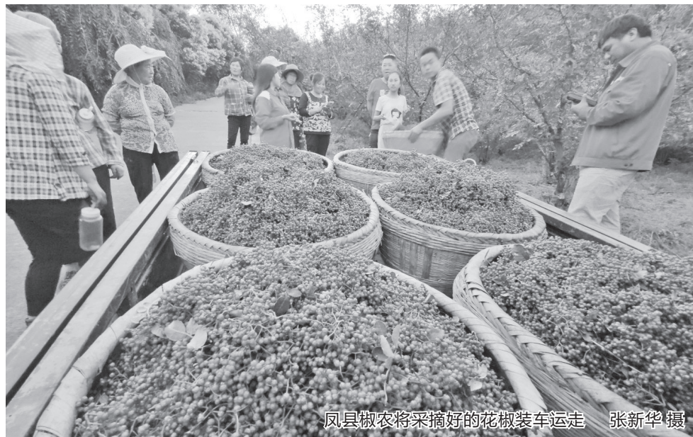
凤县椒农将采摘好的花椒装车运走

为了让科技之水浇灌出品质之花,近年来宝鸡农业发展始终坚持科技引领,建成了3个关中奶山羊、矮砧苹果和高山蔬菜研究院,扎根8个西农大试验示范站(基地)和6个国家农业产业技术体系综合试验站,形成了以奶山羊、水果、蔬菜、中蜂、小麦等产业为重点的8个农业协同创新示范区,累计开展合作共建