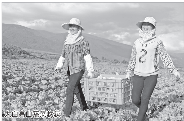
太白高山蔬菜收获

项目150多个,培育引进新品种280多个,示范推广新技术250多项。这些智囊团,在为宝鸡现代农业高质量发展注入强劲动力的同时,也构建起了宝鸡农业科技创新的“四梁八柱”。