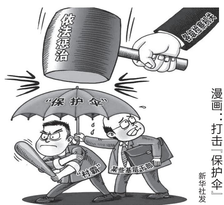
漫画：打击“保护伞”

育活动。与此同时，县法院、检察院、公安局等单位，利用LED屏同步滚动播放反邪教宣传标语，县教体局在中小学校园内集中开展反邪教宣传，进一步增强对师生的反邪教教育。 活动中，各单位把集中宣传与长效宣传相结合，把理论教育与案例警示相结合，通过主题鲜明的宣传教育，提高广大干部群众识邪、防邪、拒邪、抵邪意识。当日，全县累计发放宣传资料20000余份，受教育群众13000余人。 本报记者 马庆昆