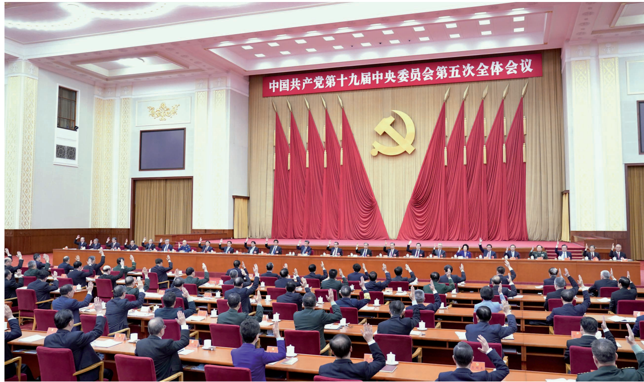
中国共产党第十九届中央委员会第五次全体会议,于2020年10月26日至29日在北京举行。中央委员会总书记习近平作重要讲话。