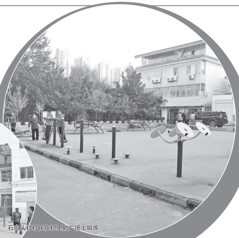
石咀头村村民在村里的广场上锻炼