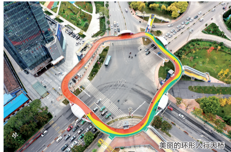
美丽的环形人行天桥

鸡市城市精神中“闻鸡起舞、开放创新”的元素，凤凰是建筑设计的主要灵感来源。另外，宝鸡钛业股份有限公司为宝鸡大剧院制作了大约2.6万平方米的“造型屋面”，使“宝鸡·中国钛谷”拥有了自己的绿色环保的钛屋顶建筑。