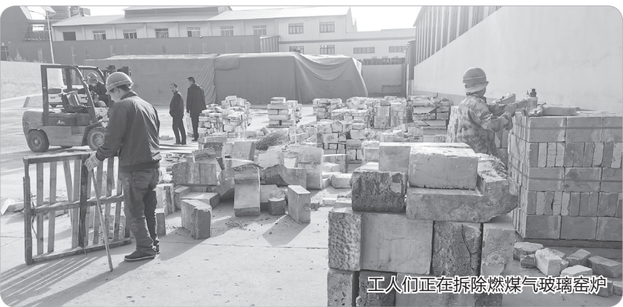
工人们正在拆除燃煤玻璃窑炉

10月20日上午10时，位于陈仓区周原镇的育才玻璃制瓶有限公司，6号窑炉熊熊大火逐渐熄灭，这个“服役”了13年的燃煤玻璃窑炉终于完成了自己的历史使命，慢慢冷却，归于沉寂。伴随着6号窑炉的停用，育才玻璃制瓶有限公司吹响了清洁能源改造的冲锋号：对原有七座燃煤玻璃窑炉进行改造，其中两座玻璃窑炉已经完成清洁化改造和环保验收，刚刚熄火