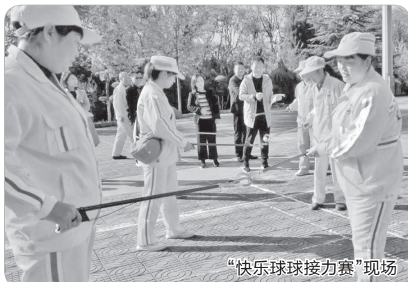
“快乐球球接力赛”现场

球、趣味保龄球等个人比赛项目妙趣横生，使运动会高潮迭起。60多名环卫工人，通过比赛加深了同事之间的感情，增进了团队凝聚力，展现出了“城市美容师”的良好精神风貌。本报记者 马庆昆