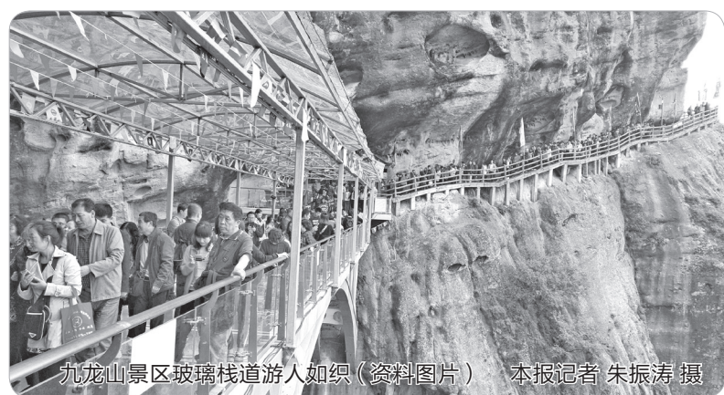
九龙山景区玻璃栈道游人如织(资料图片)

近年来,陈仓区委、区政府借脱贫攻坚之东风,谋共奔小康之宏图,不断加大基础设施建设力度,全力推进“旅游+扶贫”等重点项目。一是打通了旅游扶贫“最后一公里”。结合大水川旅游开发,实施了75公里道路新建和拓宽改造工程建设,连接