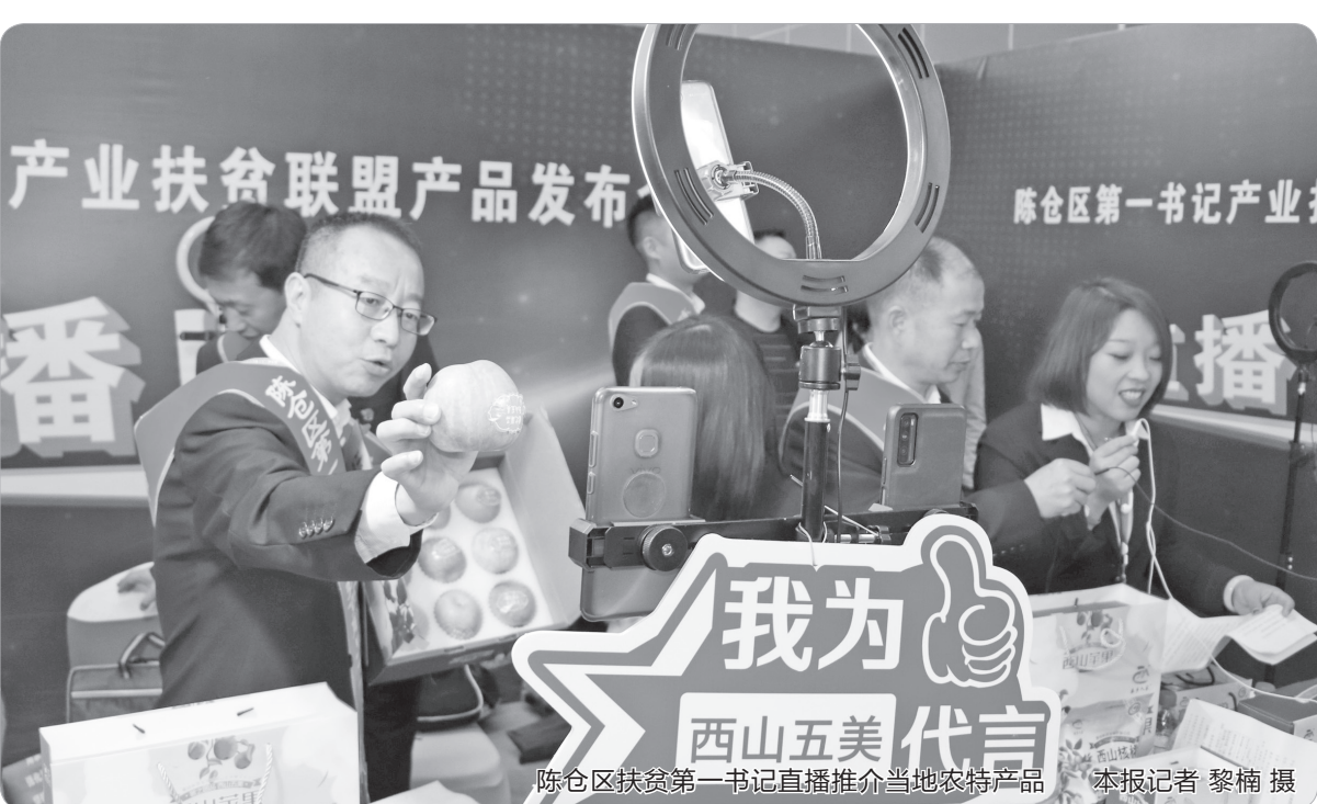
陈仓区扶贫第一书记直播推介当地农产品

近年来,陈仓区针对西部山区贫困面积大、贫困程度深的现状,依托其独特的绿色生态优势,积极探索建立“旅游+扶贫”的发展模式,通过开发一个景区,带动一方百姓,辐射一片区域,使越来越多贫困人口摘掉“贫困帽子”,换上“小康新衣”。全区脱贫攻坚取得了显著的成效,实现55个贫困村出列、21966户81563人脱贫,贫困发生率由2014年的24.19%下降至2020年初的0.69%,真正让“绿水青山”变成了“金山银山”。