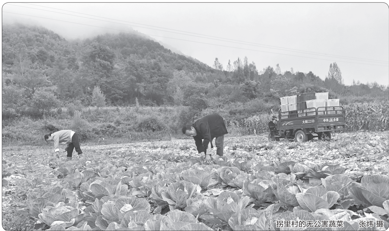
拐里村的无公害蔬菜

在秦岭深处太白县的鳌山脚下，有一个小山村叫拐里。听老一辈人讲，在很久很久以前这里叫大广镇。我知道中国有个大镇叫景德镇，是“地级镇”，叫景德镇市。咱这是“村级镇”就叫它大广镇村，现在看就是个村子。听老人们说，这个大广镇历史上是个很繁华而且远近闻名的地方，还有人说那时数百里内没有比它更热闹的地方。那时候它有多么繁华、多么热闹，到什么程度，是啥年代，却没人能说清楚。只知道它曾叫大广镇，镇上大大小小的商家字号有几十家，南来北往的旅客商贩络绎不绝，四面八方的人都来这里做生意，杂货店、布庄、饭庄、裁缝店、骡马店、药铺、酒坊、醋坊、油坊、粉坊布满全镇。正南水磨就有十座，这是真的，我小时候村子南边一溜溜还有八九座水磨，而且我在每个水磨里都磨过面。