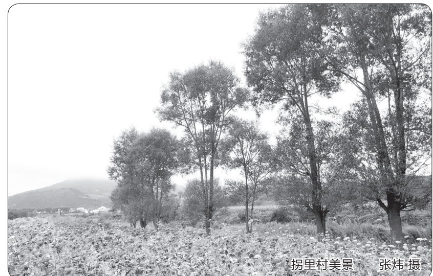
拐里村美景

如今，拐里的土坯平房都变成了二层楼，或者是农家小院，人寿年丰，不知再过几十年，不论过去的大广镇，还是现在的拐里村，将变成什么样子呢？有一点是肯定的，一定比今天更美丽、更漂亮！