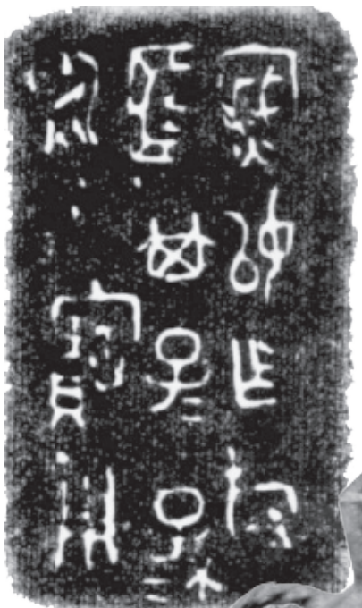
密姒簋腹内所铸铭文

中国古代几大姓氏中,子、姬、嬴姓家族的遗迹在周原地区时有发生,但罕见明确的姒姓家族遗迹,在青铜器之乡周原发现窖藏并不奇怪,何况只有出土区区几件青铜器的庄白二号窖藏,出土器物其貌不扬,铭文也不长,难怪虽然发现已40多年,却一直默默无闻。但一斑可窥全豹,从庄白二号窖藏铜器铭文中我们发现了周原的姒姓家族的踪迹,是相距200多米处齐家窖藏所属仲氏家族之小宗,该窖藏对研究周原诸多铜器窖藏的族属及大宗与小宗关系,有一定的启发意义。(作者系宝鸡市考古研究所所长)