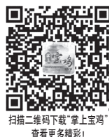
扫描二维码下载“掌上宝鸡”，查看更多精彩！