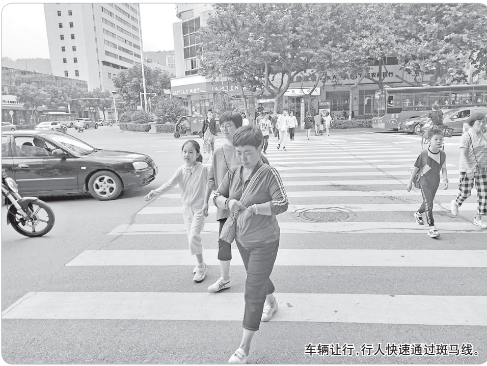
车辆让行,行人快速通过斑马线。