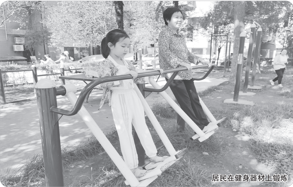
居民在健身器材上锻炼

“这几年,我们翻新了老旧小区,启动了路面修整、外墙翻新、通下水道、绿化美化等工程,辖区面貌焕然一新,居民住着舒心,我们的工作也得到更积极的支持和配合,创文让生活更美好。”8月25日,金台区中山西路街道办事处负责人说,街道办管辖着152栋楼,只有20栋有物业,老旧小区多,但经过多年创文,整个街道洋溢着文明新风。