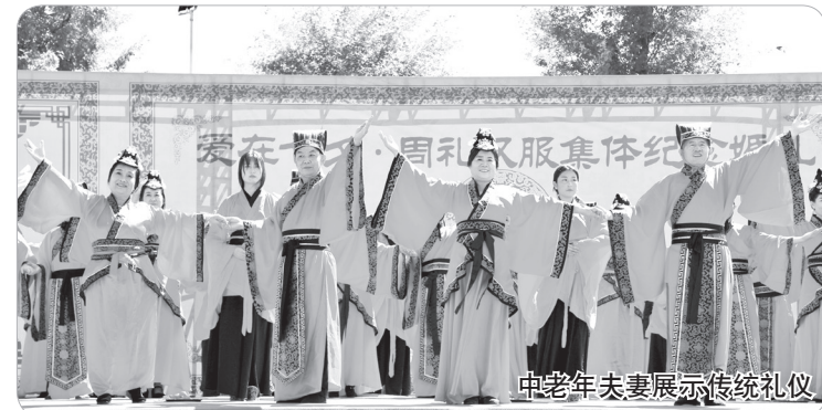
中老年夫妻展示传统礼仪