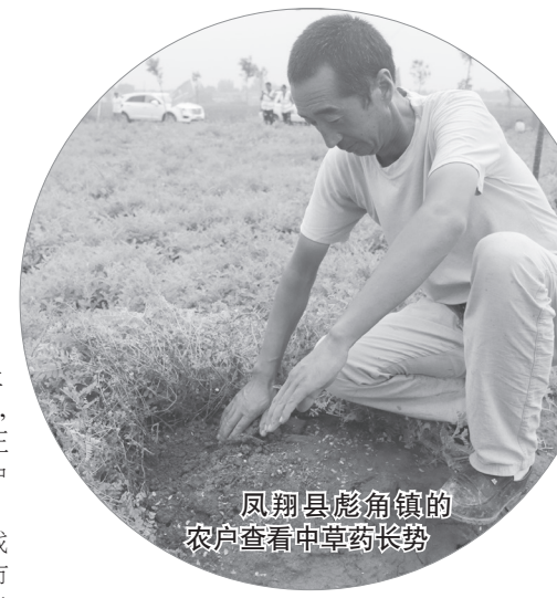
凤翔县彪角镇的农户查看中草药长势

近年来,我市将中医药列为战略性新兴产业,先后制定了《宝鸡市关于促进中医药发展的实施意见》《宝鸡市中医药产业发展中长期规划(2016-2025年)》《宝鸡市中医药发展战略规划(2017-2030年)》,加大发展中医药产业力度。市县农业部门以强化组织领导、细化工作任务、加大扶持力度、搞好技术服务为主线,从自身的区位优势出发,因地制宜,初步建立起“技术人员+合作社(公司)+基地+农户”的药材种植发展