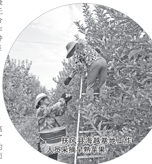
扶风县海越基地工作人员采摘早熟苹果

积达102万亩的全国最大的矮砧苹果生产基地。全市苹果种植面积132万亩,年产量117万吨。