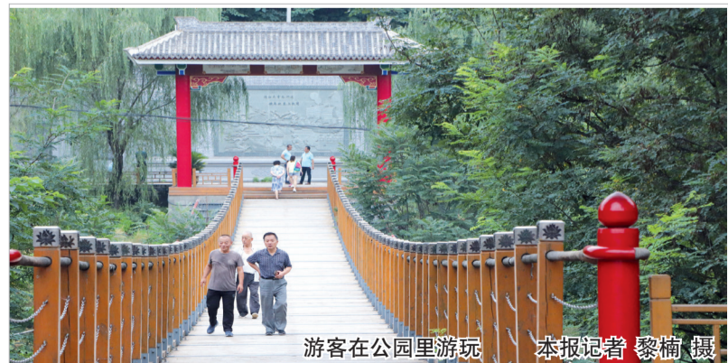
游客在公园里游玩