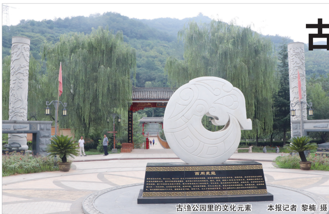
古强园里的文化元素

当年在清理强伯墓葬时，考古人员在旁边又发现了一座墓葬，它的一角与强伯墓葬“重叠”，且晚于强伯的墓葬，规模宏大，有丰富的陪葬品。在礼制森严的西周时期，只有生前地位显贵之人才享受如此的奢华，这个人就是井姬！通过考古人员的勾勒，三千多年前发生于此地的一幕，在人们面前慢慢展现出来：为了稳固政权，强伯迎娶井姬，井姬与一直得宠的小妾“儿”相处得并不和睦。后来强伯死了，丧葬大事只有正室才有发言权。于是，最宠爱的“儿”妾被殉葬了。至于井姬为何不与丈夫合葬，只在跟前另辟墓室，便成了千古之谜。