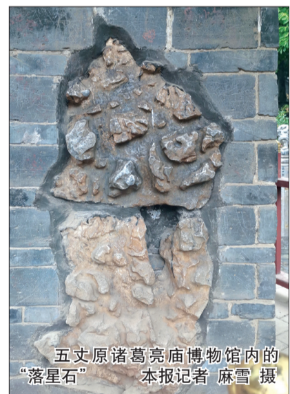
五丈原诸葛亮庙博物馆内的“落星石”

然而,有一点可以肯定,从古至今,人们对诸葛亮与“落星石”的传说津津乐道,也对这位“千秋名相”抱有无限的追思和崇敬之情。诸葛亮“鞠躬尽瘁,死而后已”的精神,在秦岭北麓的五丈原千古流芳。