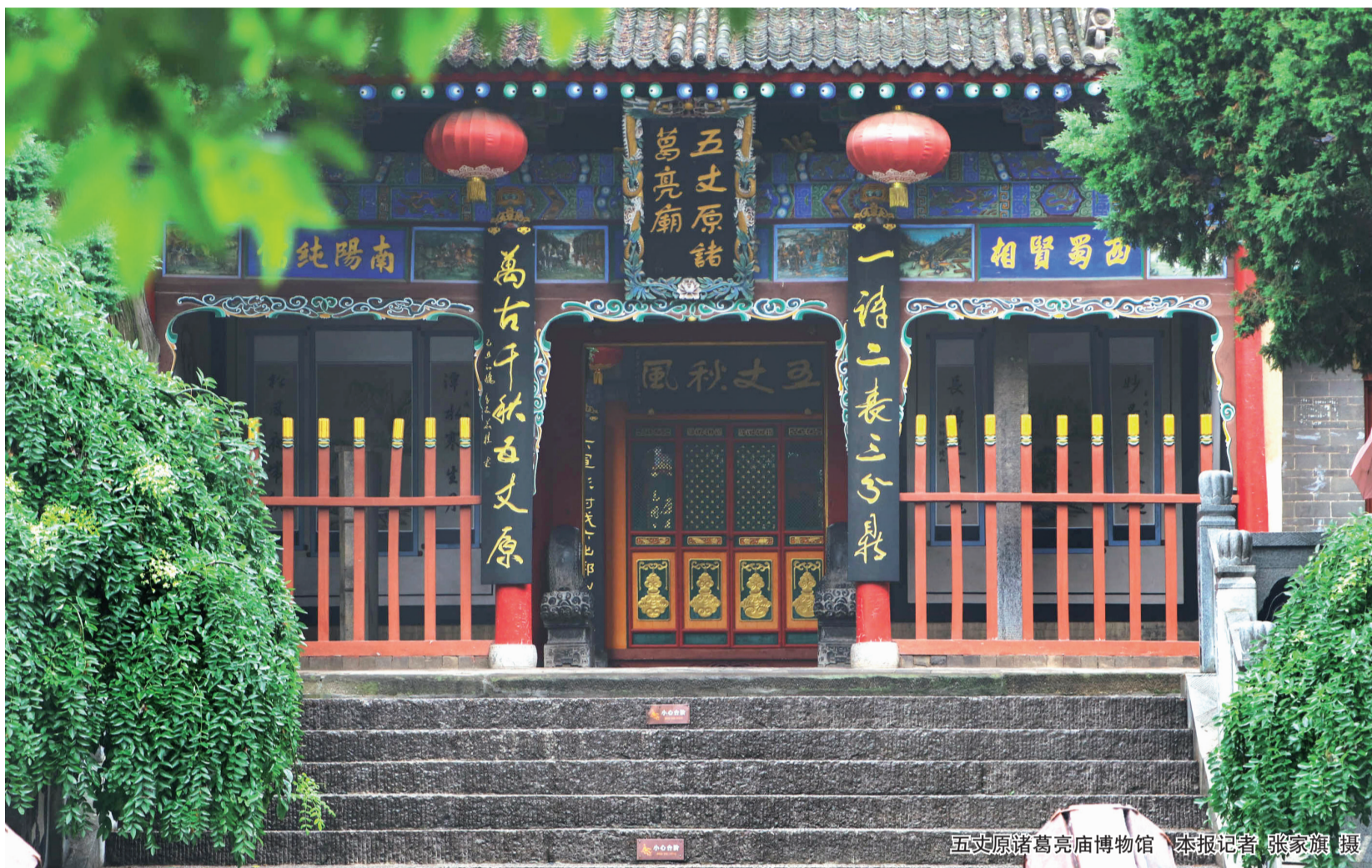
五丈原诸葛亮庙博物馆