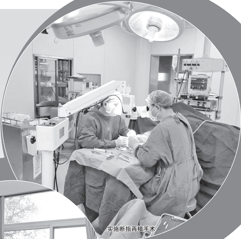
实施断指再植手术