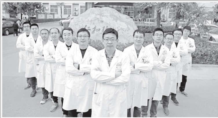
市中医医院手足显微骨科·足踝外科医疗科研团队