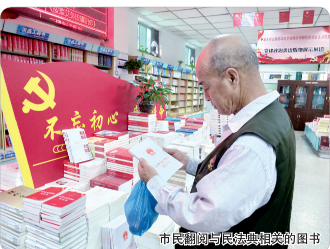
市民翻阅与民法典相关的图书