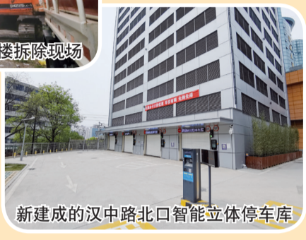
新建成的汉中路北口智能立体停车场