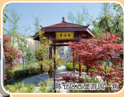
陈仓区西堡游园一角