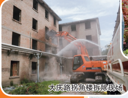
大庆路拐角楼拆除现场

2016年5月，市委、市政府审时度势，科学决策，顺应中省城市建设大形势，顺应幸福宝鸡建设总目标，顺应群众对城市建设发展需求，在全省率先启动了城市建成区“五拆”工作，对城市建设中存在的“拦路虎”“牛皮癣”进行拆