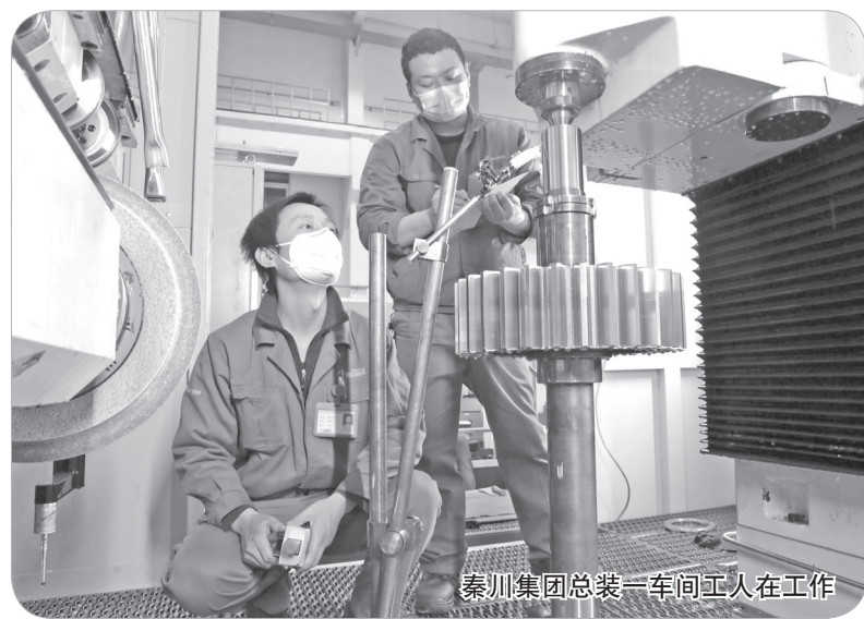
秦川集团总装一车间工人在工作