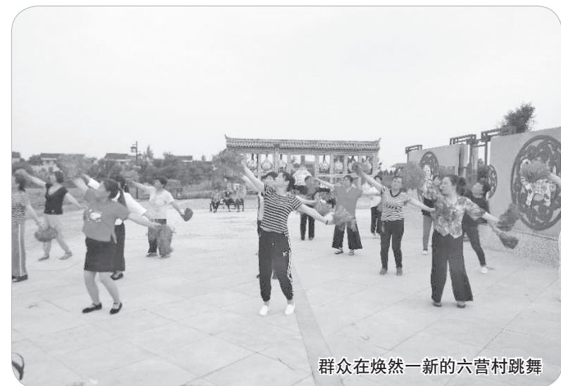
群众在焕然一新的六营村跳舞