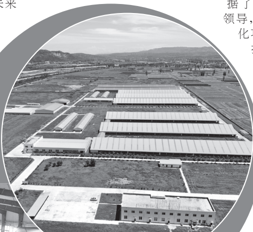
绿能牧业4万只羊场

陇县市场监管局相关负责人表示,建设标准化奶山羊养殖场不仅有利于加快产业转型升级,保护当地的生态环境,保障生鲜乳质量安全,还将带动全县发展奶山羊100万只,带动6000人就业,全产业链产值将达到200亿元。(张蓉)