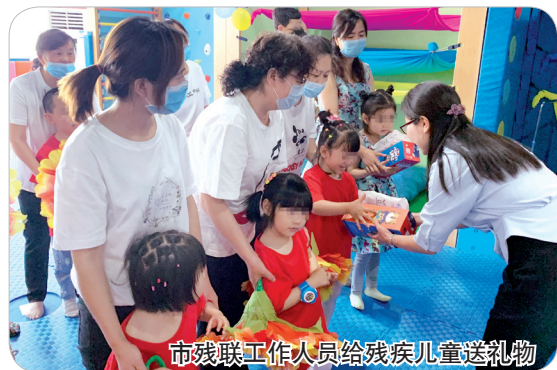
市残联工作人员给残疾儿童送礼物

5月29日,在“六一”国际儿童节到来之际,市残疾人联合会负责人带领工作人员先后前往市妇幼保健院儿童康复中心、市启聪中心、市青青草康复教育中心、市特殊教育学校,走访慰问残疾儿童,为他们送上节日的祝福。