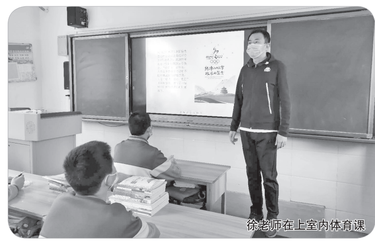
徐老师在室内体育课