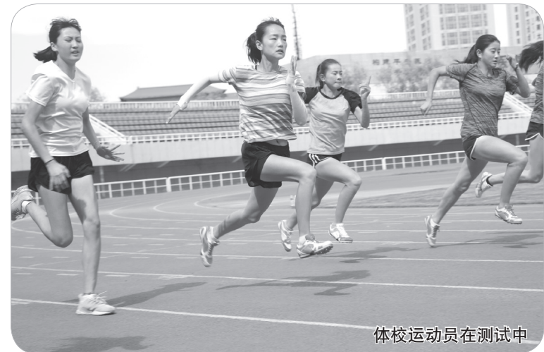
体校运动员在测试中