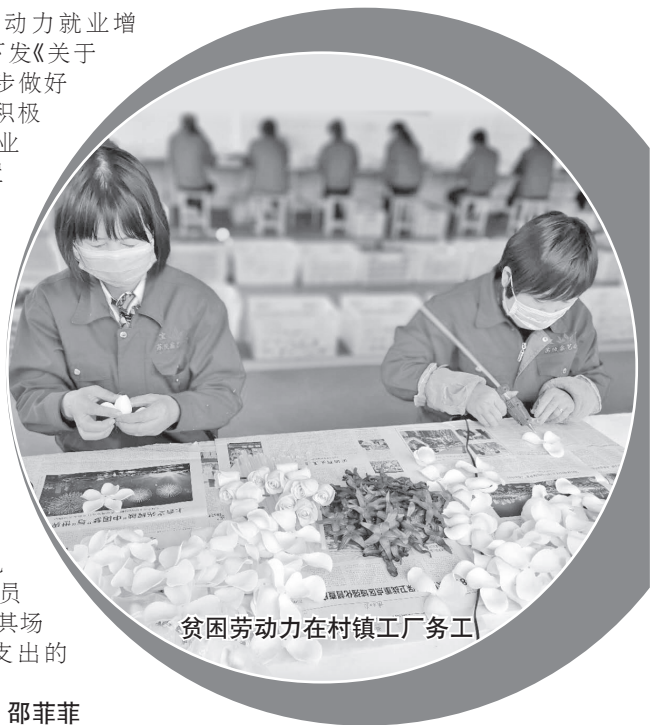
贫困劳动力在村镇工厂务工