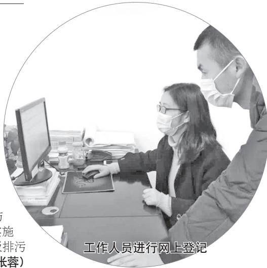
工作人员进行网上登记 (张蓉)

境部门审核,违反核发禁止性规定的,将不予核发排污许可证,企业不得发生排污行为;存在一般环境问题的,将下发限期整改通知书;经审查合格的,系统将生成排污许可证正本和副本,并在全国排污许可证管理信息平台公开,然后企业按证排污。需要提醒的是,我市在疫情防控期间,排污许可申请材料全部实施网上审核,审核通过后核发电子版排污许可证。