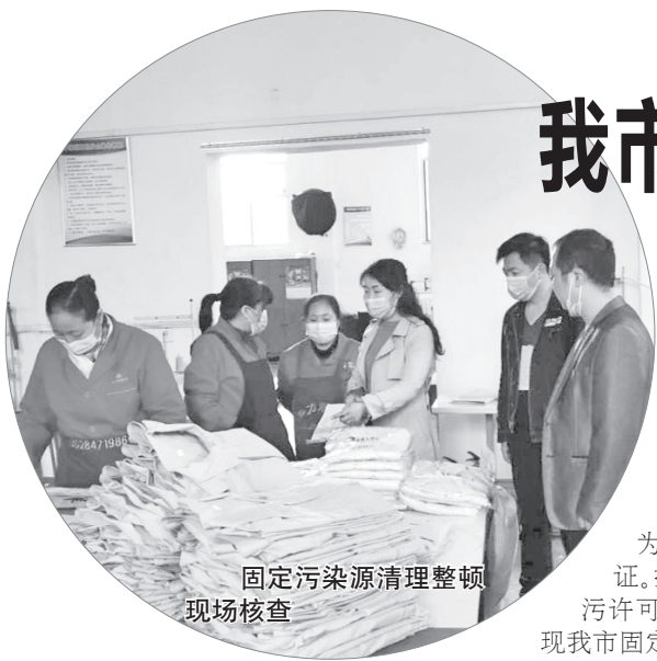
固定污染源清理整顿现场核查

本报讯 “你好,请问排污许可证怎么申报?”“我局建立了凤县排污许可企业QQ交流群,请加群,我给你截图提示办理流程。”近日,市生态环境局凤县分局采用线上办公模式,为辖区企业办理排污许可证。据了解,为完成今年排污许可证核发和登记工作,实现我市固定污染源排污许可“全覆盖”,市生态环境局各分局推出网上办