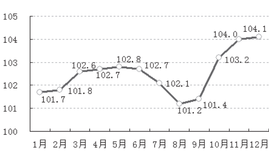
图1 2019年全市居民消费价格月度指数(CPI)(%)

全年财政总收入233.03亿元,比上年增长0.5%。其中,地方财政收入87.98亿元,同比增长5.0%。税收总收入214.08亿元,下降0.3%。全年财政支出350.12亿元,比上年增长6.0%。其中,城乡社区事务支出36.55亿元,增长50.8%;节能环保支出13.67亿元,增长38.4%;卫生健康支出36.6亿元,增长7.0%;教育支出64.01亿元,增长2.6%;农林水事务支出39.36亿元,增长1.1%;社会保障和就业支出55.55亿元,下降2.7%。