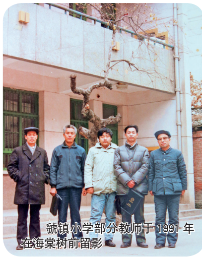
虢镇小学部分教师于1991年在海棠树前留影

1987年，虢镇小学修建校舍，因为考虑到海棠树的重要性，故没有挖除，但没想到教学楼盖起来后，一方面遮挡了阳光，另一方面原来的土地被灌上水泥，树