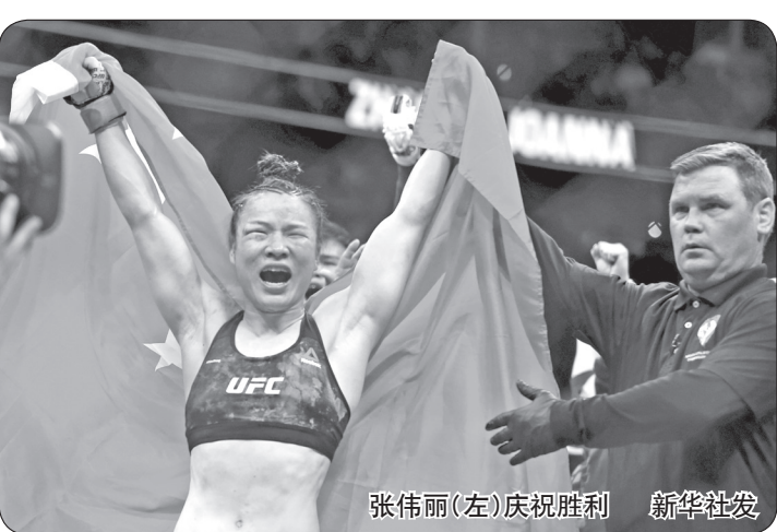
张伟丽(左)庆祝胜利

新华社北京3月8日电 北京时间8日,经过五回合激烈战斗,中国首位UFC(终极格斗冠军赛)冠军张伟丽在美国拉斯维加斯举行的UFC248站女子草量级卫冕战中,以点胜击败波兰选手乔安娜,成功卫冕金腰带。