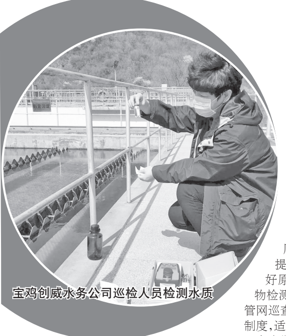
宝鸡创威水务公司巡检人员检测水质

自来水、天然气和暖气等公用事业与群众生活息息相关。为保障新冠肺炎疫情期间居民水、气、暖供应安全，我市相关公用事业单位把责任扛在肩上，奋战在岗位一线，保障广大市民正常生产生活。