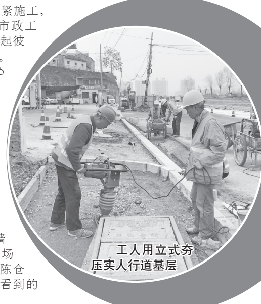
工人用立式夯压实人行道基层