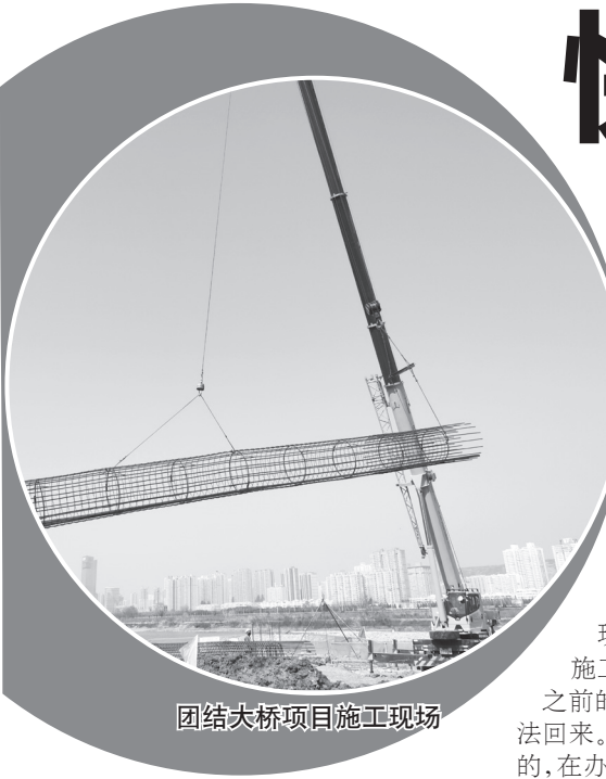
团结大桥项目施工现场

春回大地，万物复苏，渭河两岸奏响了春的“乐章”。日前，记者先后来到我市五座渭河新建大桥施工现场，河道内机器轰鸣，车辆往来穿梭，近300名施工人员正在全力施工架“飞虹”。