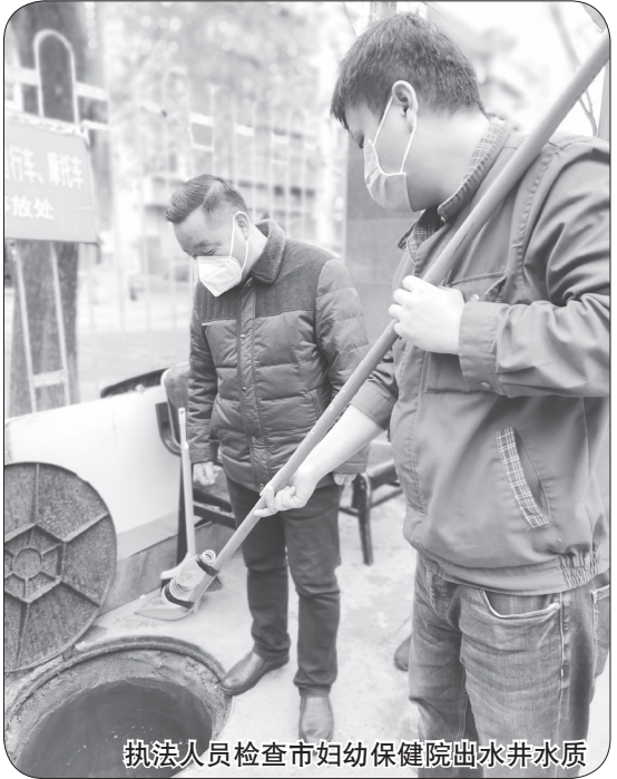
执法人员检查市妇幼保健院出水井水质