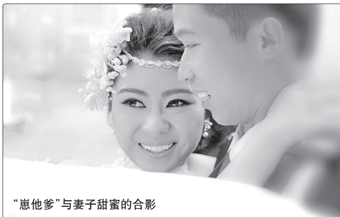
“崽他爹”与妻子甜蜜的合影

每当我问你家里忙不忙、带娃累不累的时候，你总是对我说“忙你的，家里能有啥事儿”。从没管过家中日常、仿佛不食人间烟火的我，真的以为“家里没有啥事儿”。一次我母亲打电话给我，说家里什么都有，不需要寄太多东西，我才知道，是你一直替我尽孝，时常电话的关心、每月的生活费、时不时寄一些陕西土特产，都让二