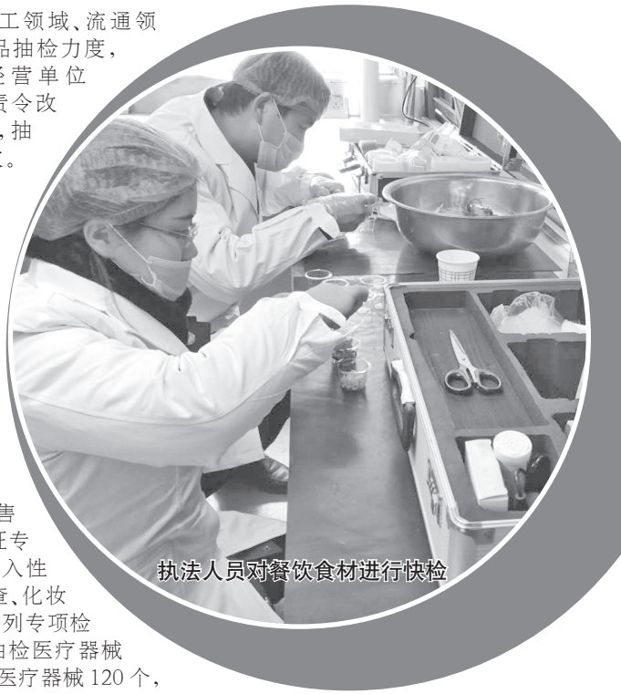
执法人员对餐饮食材进行快检

在此基础上,他们进一步加强了对药品质量的监管。加大药品、医疗器械抽检力度,开展了零售药店执业药师挂证专项整治、无菌和植入性医疗器械专项检查、化妆品风险排查等一系列专项检查。截至目前,共抽检医疗器械83批次,没收非法医疗器械120个,罚款28.5万元。