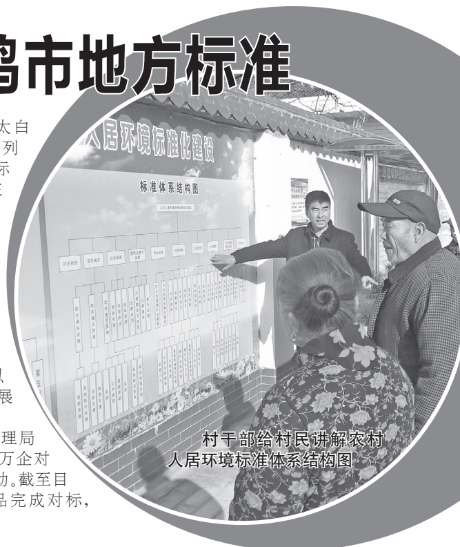
村干部给村民讲解农村人居环境标准体系结构图

市市场监督管理局还开展了百城千业万企对标达标提升专项行动。截至目前,全市216个产品完成对标,位居全国第十七位。