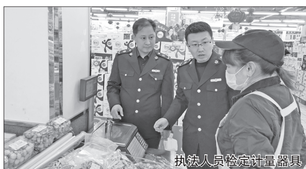
执法人员检定计量器具

全市市场监管部门还深入开展了“5·20”世界计量日系列宣传活动,免费检定计量器具250台(件)。