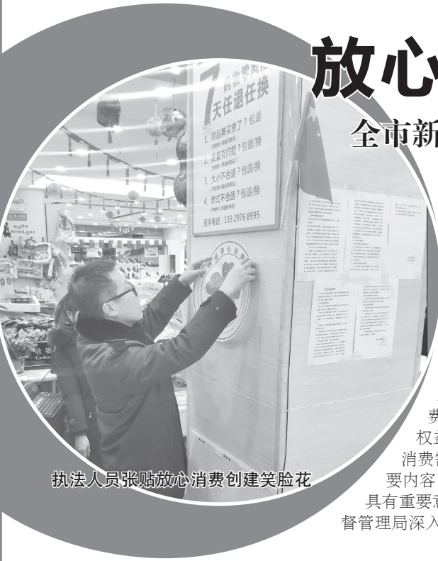
执法人员张贴放心消费创建笑脸花

与此同时,他们深入开展家装市场、婴幼儿服装等专项清理整治和“3·15”系列宣传活动,加大投诉举报受理力度,全年共受理各类投诉举报6013件,为消费者挽回经济损失231万余元。