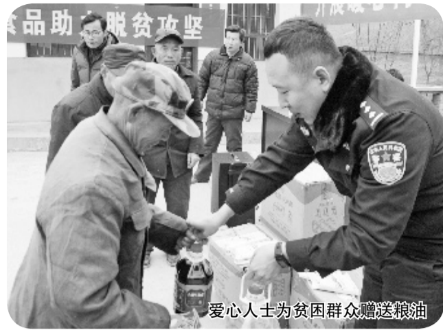
爱心人士为贫困群众赠送粮油