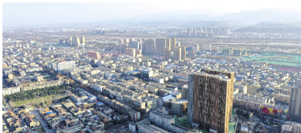
虢镇主城区

虢镇,是中国地名志中沿用时间最长的地名之一,有渭河第一镇之称。尽管虢国的故事已成为传说,摆渡的码头也已消失,换驼的商队早已远去,但它的味道至今依然浓郁。