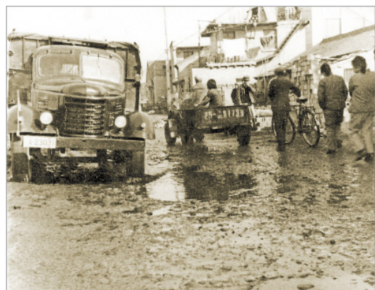
虢镇火车站站前路面 1980年摄