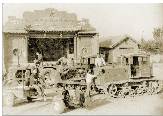
虢镇西秦大队农机大院 1975年摄