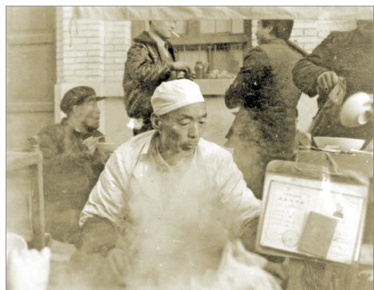
虢镇街道卖醪糟的个体户 1983年摄