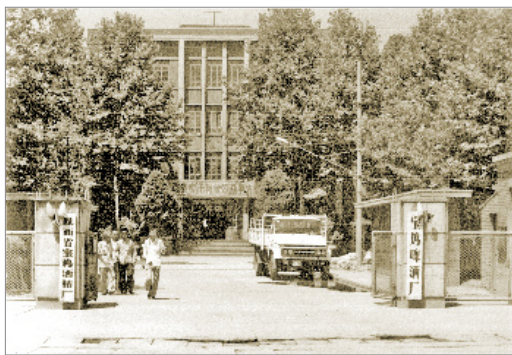
原宝鸡啤酒厂 1986年摄