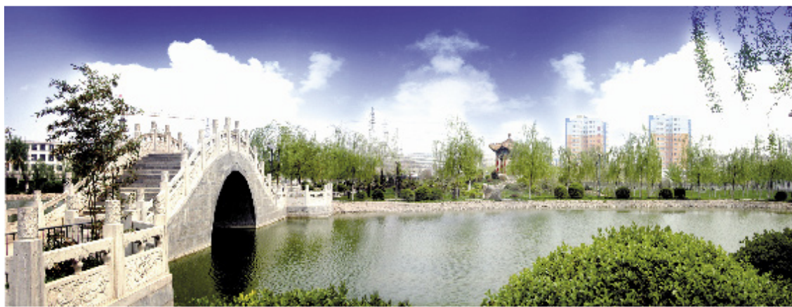
虢镇游园一角 2018年摄