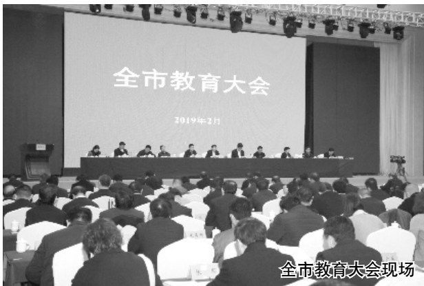
全市教育大会现场

“推动宝鸡在西部地区率先基本实现教育现代化,率先建成教育强市。”2月28日,在2019年宝鸡市教育大会上,市委、市政府为我市描绘出了这样的宏伟蓝图,开启了新时代宝鸡教育的奋进之旅。