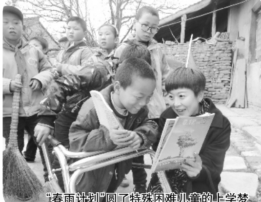
“春雨计划”圆了特殊困难儿童的上学梦

10月16日,教育部官网开辟专栏,集中推介了一批教育扶贫工作典型案例,我市的“控辍保学”工作榜上有名。据悉,陕西省此次共有7个典型案例成功入选教育部推介案例,宝鸡占了4个。