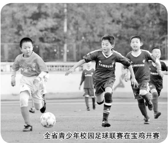
全省青少年校园足球联赛在宝鸡开赛