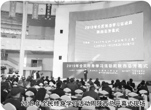
2019年全国终身学习活动周陕西总开幕式现场

12月6日,首届全民终身学习活动周陕西总开幕式在我市举行。开幕式上传来喜讯,我市2个项目获评全国“终身学习品牌”、4个项目获评陕西省“终身学习品牌项目”、12人荣获陕西省“百姓学习之星”称号。