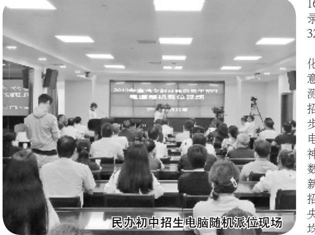
民办初中招生电脑随机派位现场

7月20日下午,我市首次对报名人数超过招生计划的三所民办初中招生实行电脑随机派位。7838名学生参加“摇号”,1674名学生被录取。其中宝鸡市第一中学录取了954人,宝鸡高新第一中学录取了320人,宝鸡新希望中学录取了400人。