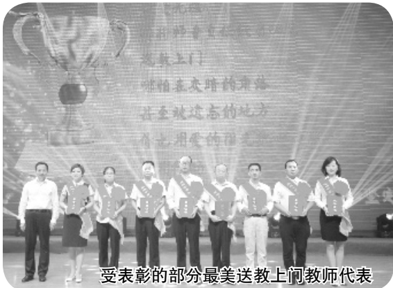
受表彰的部分最美送教上门教师代表

3月23日,2019年陕西省青少年校园足球联赛启动仪式在我市举行,打响了2019年全省青少年校园足球联赛第一枪。