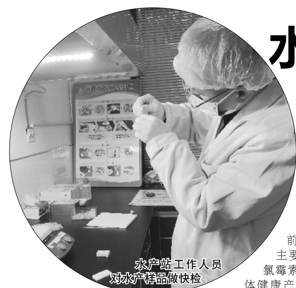
水产站工作人员对水产样品做快检