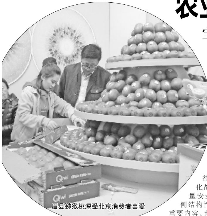
眉县猕猴桃深受北京消费者喜爱