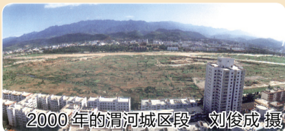
2000年的渭河城区段