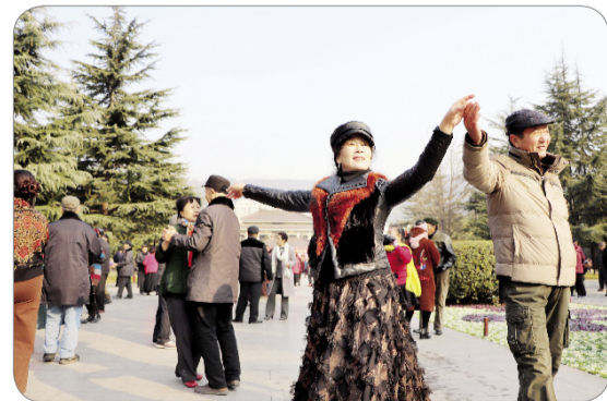
市民在炎帝园广场跳舞