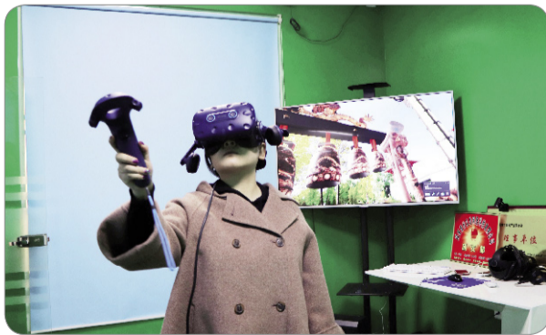
市民在渭滨科技网络创业大厦体验VR