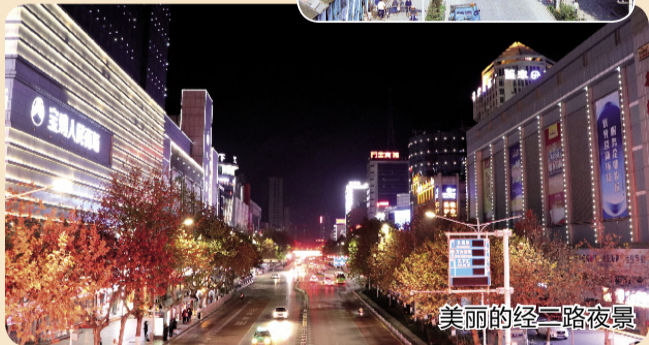
美丽的经二路夜景